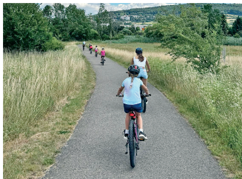
Radtour nach Treuchtlingen

Am letzten Juni Wochenende fand in unserem Skiclubhaus ein Trainingswochenende mit Übernachtung statt. Neun Kids unternahmen mit ihren drei Betreuern die unterschiedlichsten Aktivitäten.