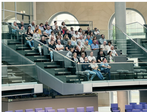
Besuchertribüne des Plenarsaals

Nach entspannter Anreise und den ersten Erkundungstouren durch Berlin starteten wir am nächsten Morgen mit einem Besuch im Auswärtigen Amt. Ein Referent vom diplomatischen Dienst beantwortete die Fragen der Teilnehmer zu aktuellen außenpolitischen Themen. Er beeindruckte uns mit äußerst fundierten Antworten über die komplexen Zusammenhänge internationaler Politik und hoch interessanten Berichten über seine vielfältigen Einsätze weltweit.