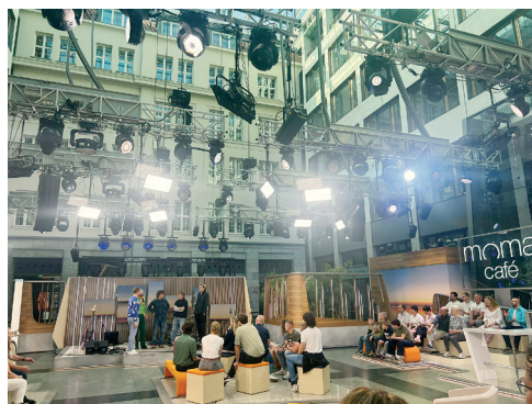
Im ZDF-Morgenmagazin (moma-Café)