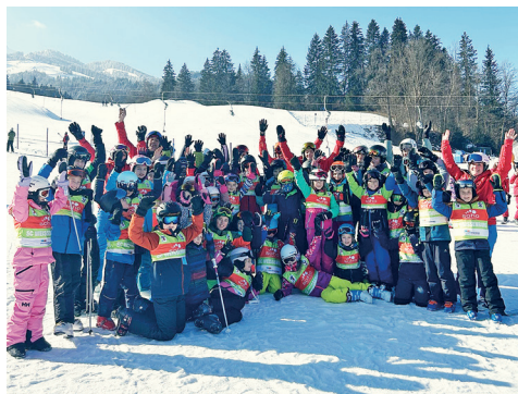
Tagesfahrt St. Johann

108 schneesportbegeisterte Ski- und Snowboardfahrer begleiteten uns zur ersten Wochenendfahrt nach Innsbruck. An der Skifahrt nahmen auch zwei Angehörige der Feuerwehr Baar-Ebenhausen teil, die von uns an unserer 50-Jahr-Feier eine Einladung erhielten. Sehr unbeständige Schnee- und Wetterverhältnisse machten es unseren acht Übungsleiterinnen und Übungsleiter nicht leicht, die 38 Skischüler an diesem Wochenende zu trainieren.