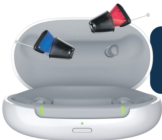
Signia Silk Charge&Go IX mit Ladestation